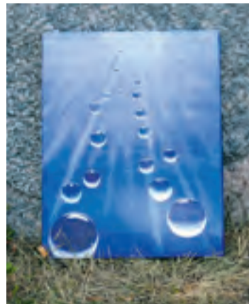
BUBBLOR. Är en del av en tavelserie. ”Varje bubbla är en själ”.

Motto: Allt jag är med om ger mig visdom.