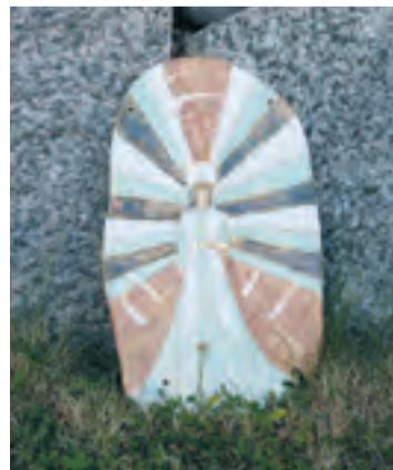
ÄNGEL MED BOK. En av fem ängla-ikoner i stengods som visas.